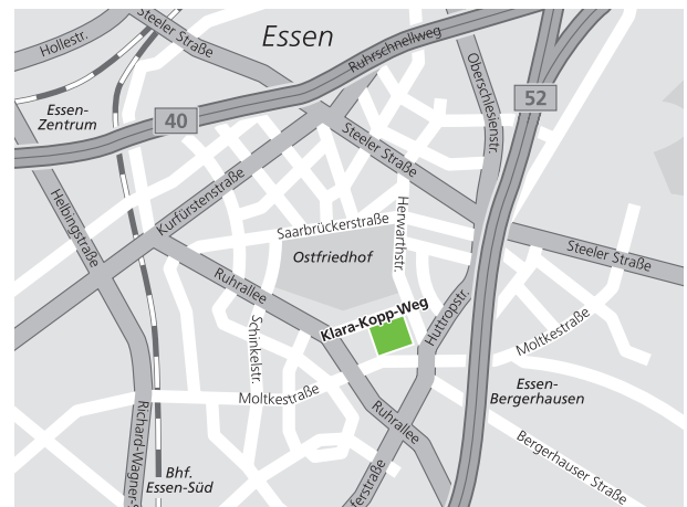
Ambulante Operationen: Elisabeth-Krankenhaus, Klara-Kopp-Weg 1, 45138 Essen